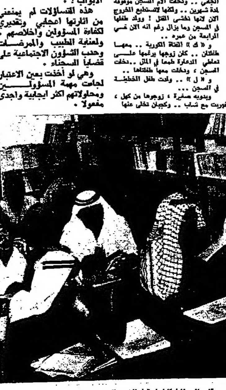
في مكتبة السجن ... يقضي السجناء وقتا ممتعة في التردد بالعلم والمعرفة .